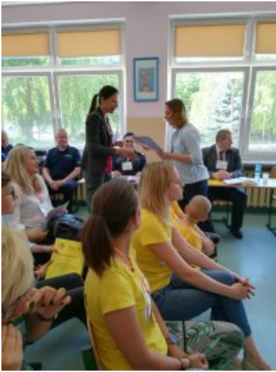
Rozstrzygnięcie Konkursów o ochronie danych osobowych