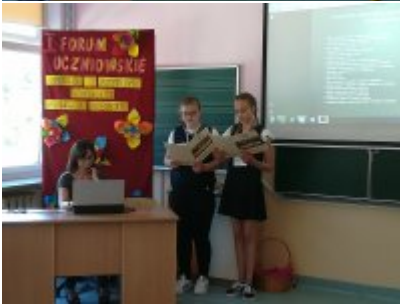
I Forum Uczniowskie