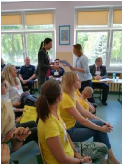
Rozstrzygnięcie Konkursów o ochronie danych osobowych