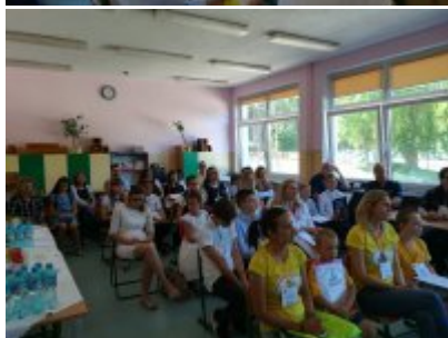
I Forum Uczniowskie