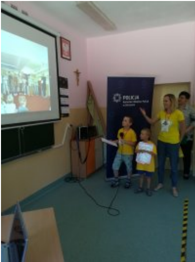
I Forum Uczniowskie