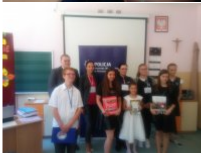
Rozstrzygnięcie Konkursów o ochronie danych osobowych