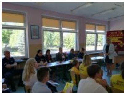
I Forum Uczniowskie