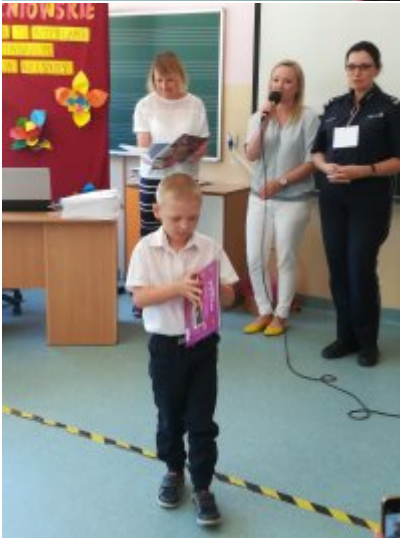
Rozstrzygnięcie Konkursów o ochronie danych osobowych