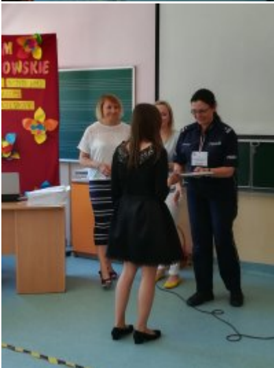
Rozstrzygnięcie Konkursów o ochronie danych osobowych