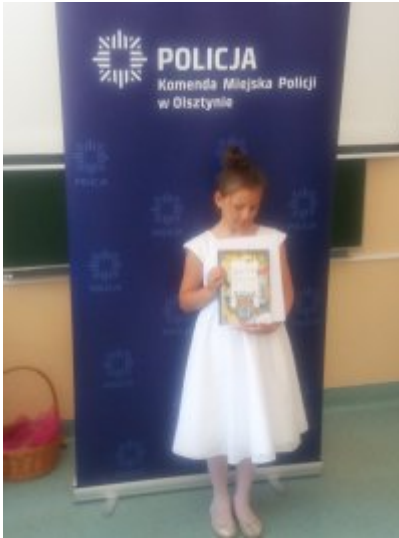
Rozstrzygnięcie Konkursów o ochronie danych osobowych