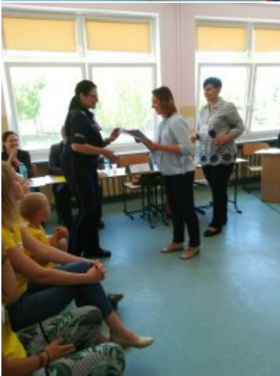
Rozstrzygnięcie Konkursów o ochronie danych osobowych