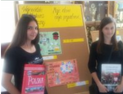
Rozstrzygnięcie Konkursów o ochronie danych osobowych