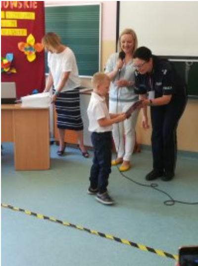
Rozstrzygnięcie Konkursów o ochronie danych osobowych