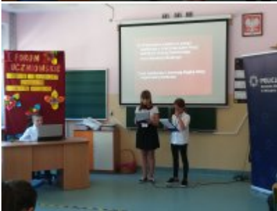
I Forum Uczniowskie