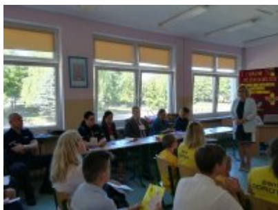
I Forum Uczniowskie