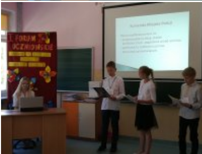
I Forum Uczniowskie