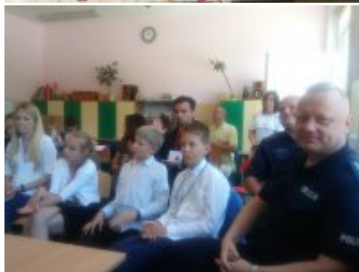
Rozstrzygnięcie Konkursów o ochronie danych osobowych