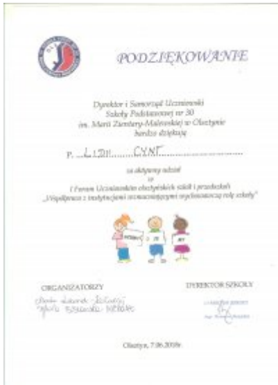
I Forum Uczniowskie