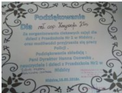
podziękowania z Nidzicy