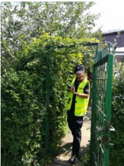
Letnie kontrole koczowisk