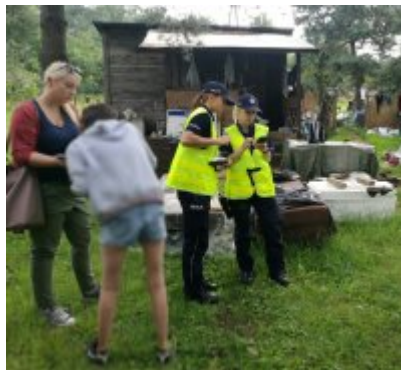
Letnie kontrole koczowisk