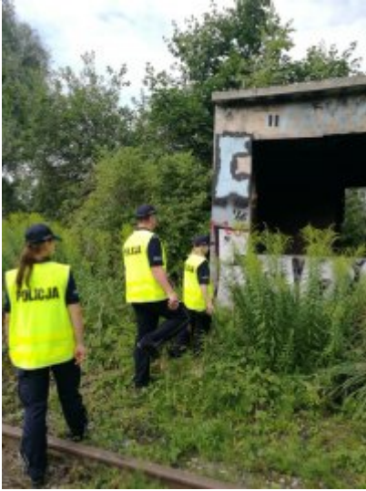
Letnie kontrole koczowisk