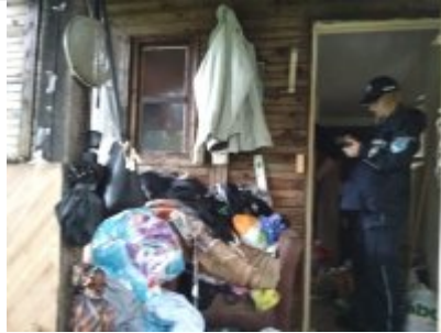
Kontrole koczowisk osób bezdomnych