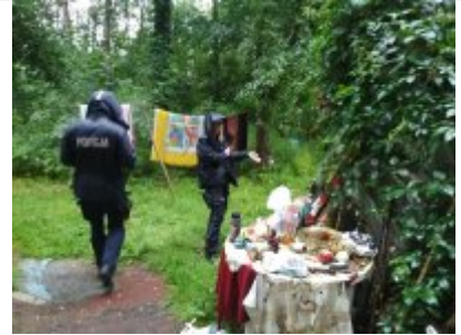
Kontrole koczowisk osób bezdomnych