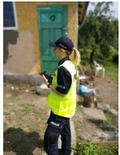
Letnie kontrole koczowisk