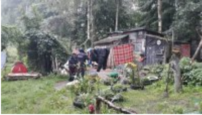
Kontrole koczowisk osób bezdomnych