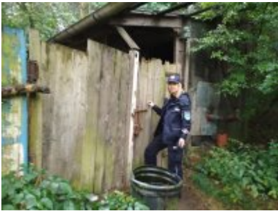
Kontrole koczowisk osób bezdomnych