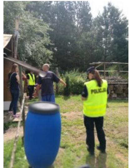
Letnie kontrole koczowisk