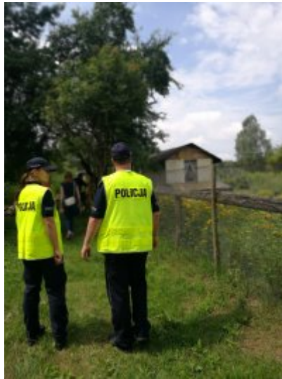
Letnie kontrole koczowisk