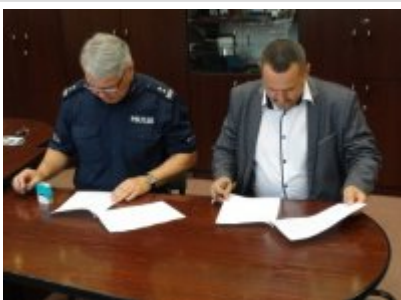
Podpisanie porozumienia z Zespołem Szkół w Biskupcu