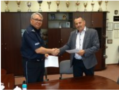
Podpisanie porozumienia z Zespołem Szkół w Biskupcu