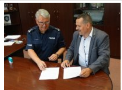
Podpisanie porozumienia z Zespołem Szkół w Biskupcu