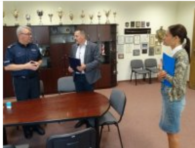
Podpisanie porozumienia z Zespołem Szkół w Biskupcu