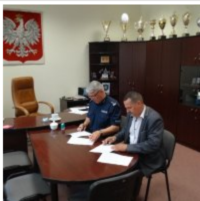
Podpisanie porozumienia z Zespołem Szkół w Biskupcu