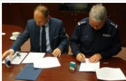
Podpisanie porozumienia z Zespołem Szkół w Dobrym Mieście