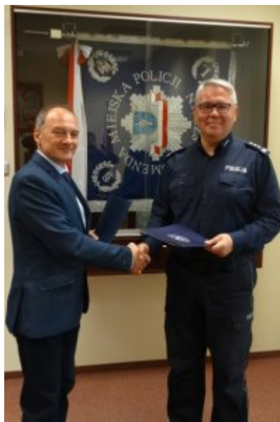
Podpisanie porozumienia z Zespołem Szkół w Dobrym Mieście