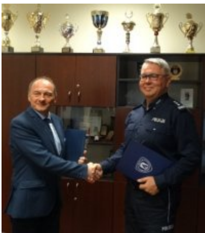
Podpisanie porozumienia z Zespołem Szkół w Dobrym Mieście