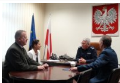
Podpisanie porozumienia z Zespołem Szkół w Dobrym Mieście