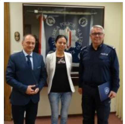
Podpisanie porozumienia z Zespołem Szkół w Dobrym Mieście