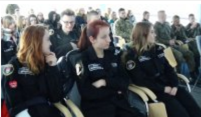
Dzień integracyjny dla klas mundurowych