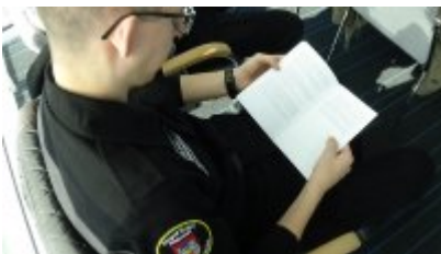
Dzień integracyjny dla klas mundurowych