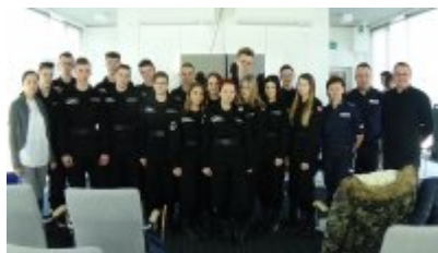
Dzień integracyjny dla klas mundurowych