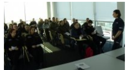
Dzień integracyjny dla klas mundurowych