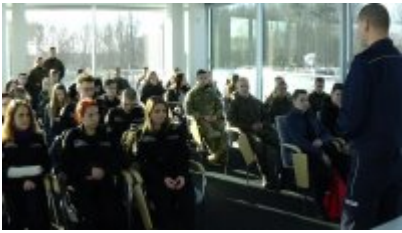
Dzień integracyjny dla klas mundurowych