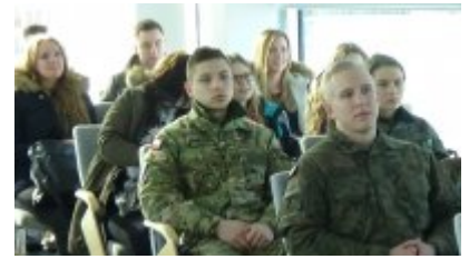
Dzień integracyjny dla klas mundurowych