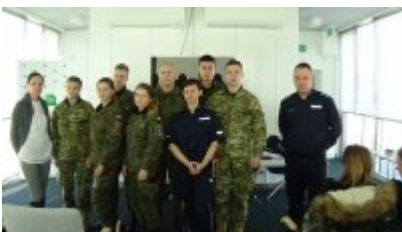
Dzień integracyjny dla klas mundurowych