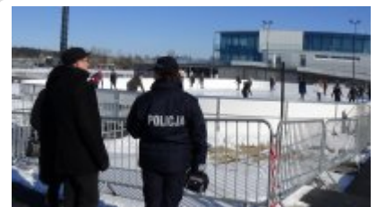
Dzień integracyjny dla klas mundurowych