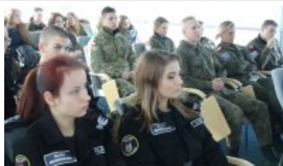
Dzień integracyjny dla klas mundurowych