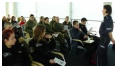
Dzień integracyjny dla klas mundurowych