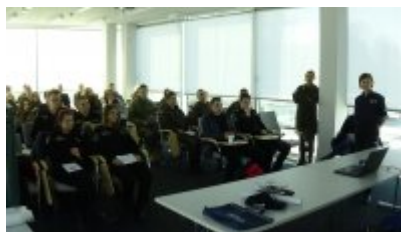
Dzień integracyjny dla klas mundurowych