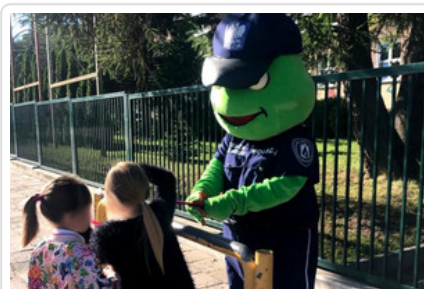
Maskotka "Sierżant Żabuś"