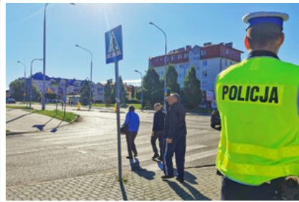
Policjant nadzorujący bezpieczeństwo w ruchu drogowym