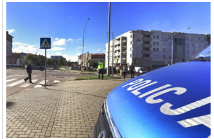
Policjant nadzorujący bezpieczeństwo w ruchu drogowym