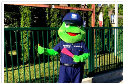
Maskotka "Sierżant Żabuś"

Funkcjonariusze od początku września skoncentrują się na nadzorowaniu przejść dla pieszych. Ze strony policjantów możemy także liczyć na pomoc w bezpiecznym przemieszczeniu się przez jezdnię, chociażby przeprowadzeniu przez pasy. Zajmą się również stałą kontrolą kierowców, to czy ich stan trzeźwości podczas kierowania pojazdem jest bez zastrzeżeń, czy posiadają wymagane wyposażenie, a także czy stan techniczny auta jest odpowiedni. Kontrolą czy w odpowiedni sposób rodzice przywożą swoje pociechy do szkół i przedszkoli zwracając szczególną uwagę na to, czy mają zapięte na sobie pasy bezpieczeństwa oraz przewożą je w foteliku.