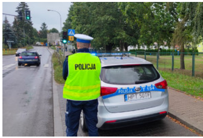
Policjant nadzorujący bezpieczeństwo w ruchu drogowym