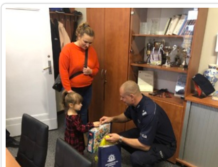
3-letnia laureatka konkursu na nazwę figurki wraz z opiekunką w pokoju Komendanta Komisariatu Policji w Biskupcu