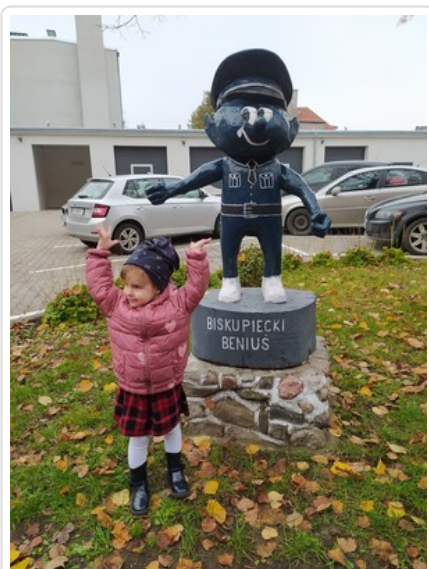
"Biskupiacki Beniuś" z 3-letnią laureatką konkursu na jego imię

https://olsztyn.policja.gov.pl/o02/aktualnosci/93831,Smerfowali-z-policjantami-z-Komisariatu-Policji-w-Biskupcu.html?search=906324904257