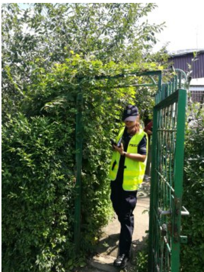
Letnie kontrole koczowisk