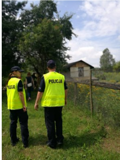
Letnie kontrole koczowisk