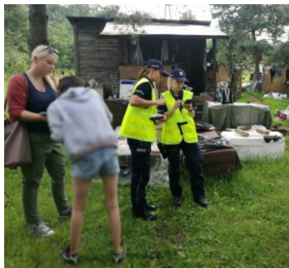
Letnie kontrole koczowisk