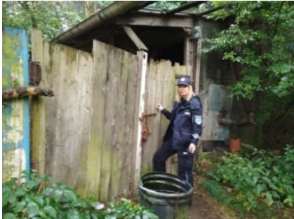
Kontrole koczowisk osób bezdomnych