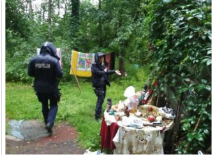
Kontrole koczowisk osób bezdomnych