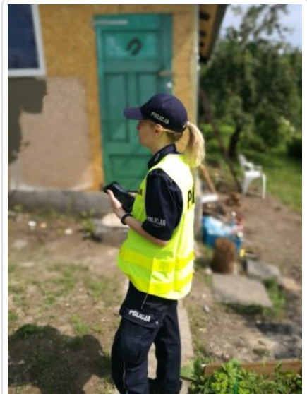
Letnie kontrole koczowisk