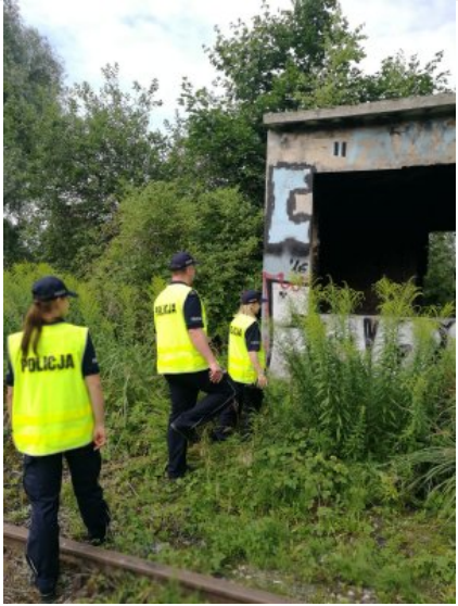
Letnie kontrole koczowisk