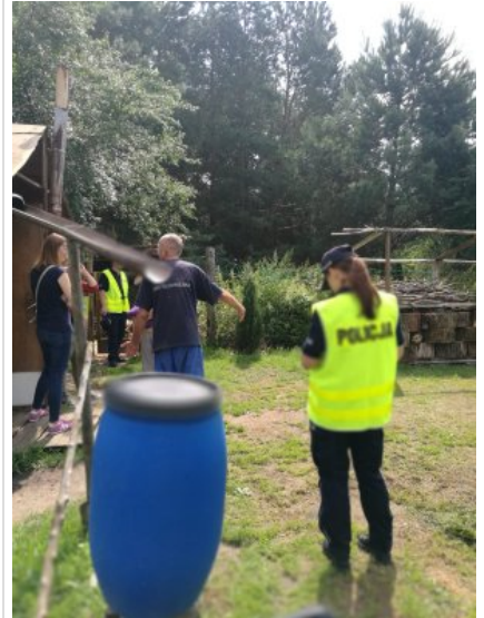
Letnie kontrole koczowisk