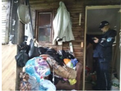
Kontrole koczowisk osób bezdomnych