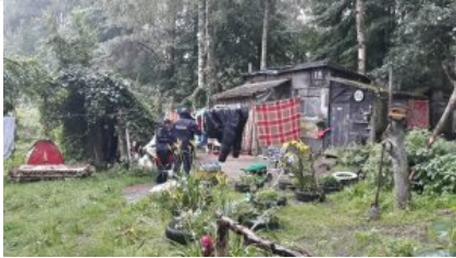
Kontrole koczowisk osób bezdomnych